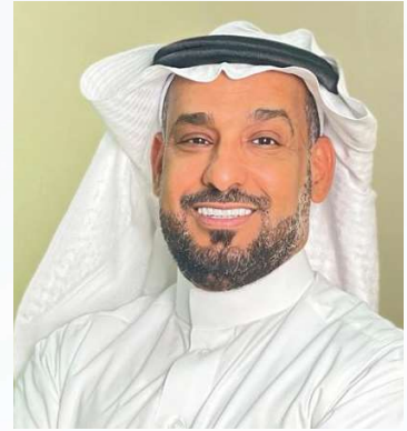
بقلم الأستاذ الدكتور / إبراهيم بن مبارك الحربي عميد كلية الأعمال