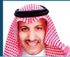
أ.د. عبدالناصر سالم آل مصلوم وكيل الكلية للشؤون الأكاديمية والتطوير ووكيل الكلية للبحث العلمي والابتكار المكلف