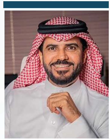
بقلم معالي الدكتور / عدنان بن سالم الحميدان رئيس جامعة جدة

ختاماً، لا يسعني إلا تقديم كل الشكر وأجزل التقدير لكل من ساهم وشارك في إعداد هذا التقرير الثري، وكلنا موعودين في جامعتنا الغراء عموماً، وكلية الأعمال على وجه الخصوص، بعام دراسي جديد مليء بالمنجزات الغير مسبوقة، والله الموفق لكل خير.